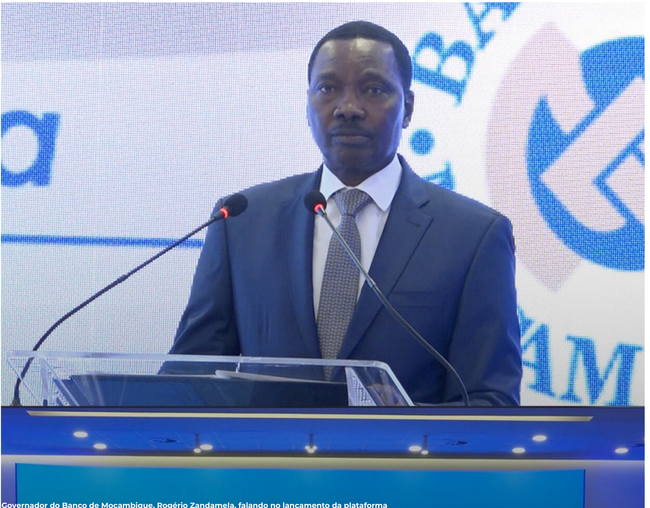
Governador do Banco de Moçambique, Rogério Zandamela, falando no lançamento da plataforma