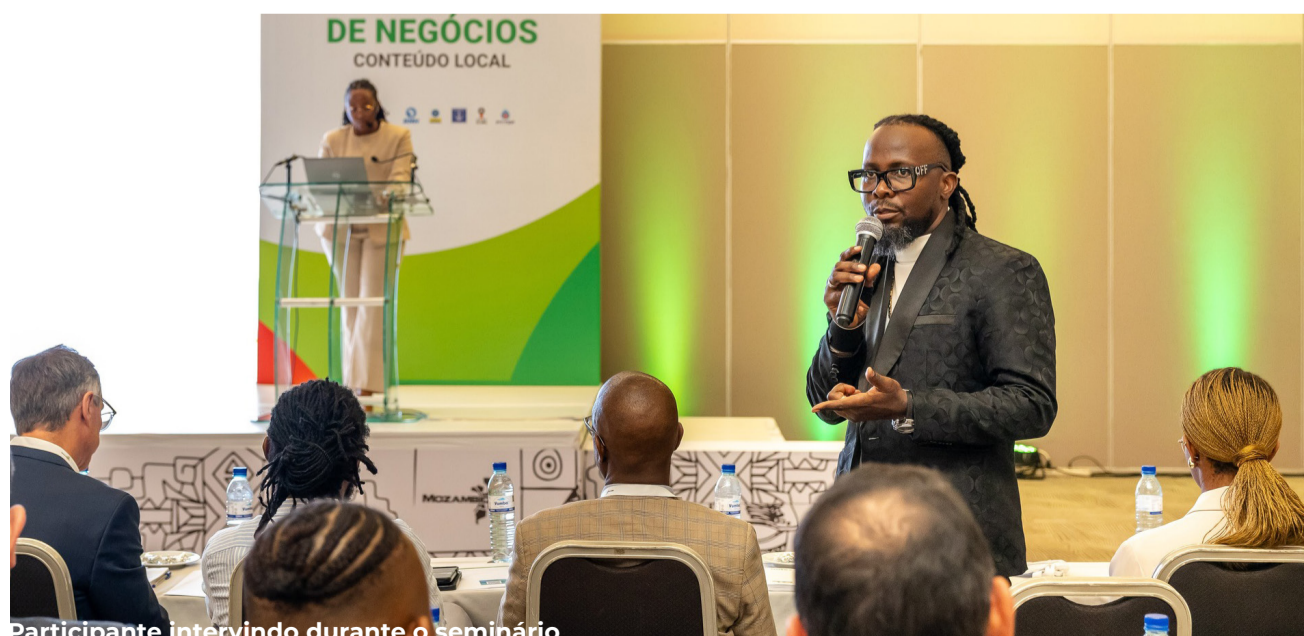
Participante intervindo durante o seminário

O projecto Mozambique LNG liderado pela TotalEnergies apresentou no passado mês de Março, em Pemba e Maputo, diversas oportunidades de negócios para empresas nacionais, no âmbito da estratégia de promoção do conteúdo local nas actividades ligadas ao gás natural.