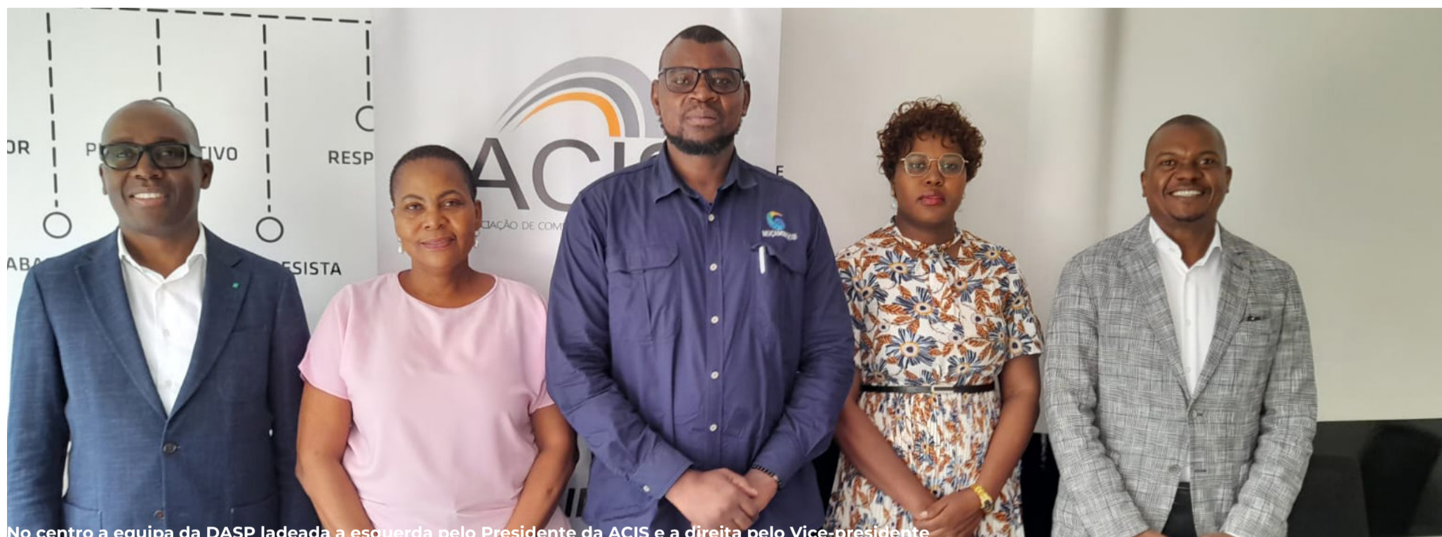
No centro a equipa da DASP ladeada a esquerda pelo Presidente da ACIS e a direita pelo Vice-presidente

A Associação de Comércio, Indústria e Serviços (ACIS) e o Ministério da Economia através da Direcção Nacional de Apoio ao Sector Privado (DASP) manifestam interesse de melhorar os mecanismos de colaboração na busca de soluções para os desafios do sector empresarial no país.