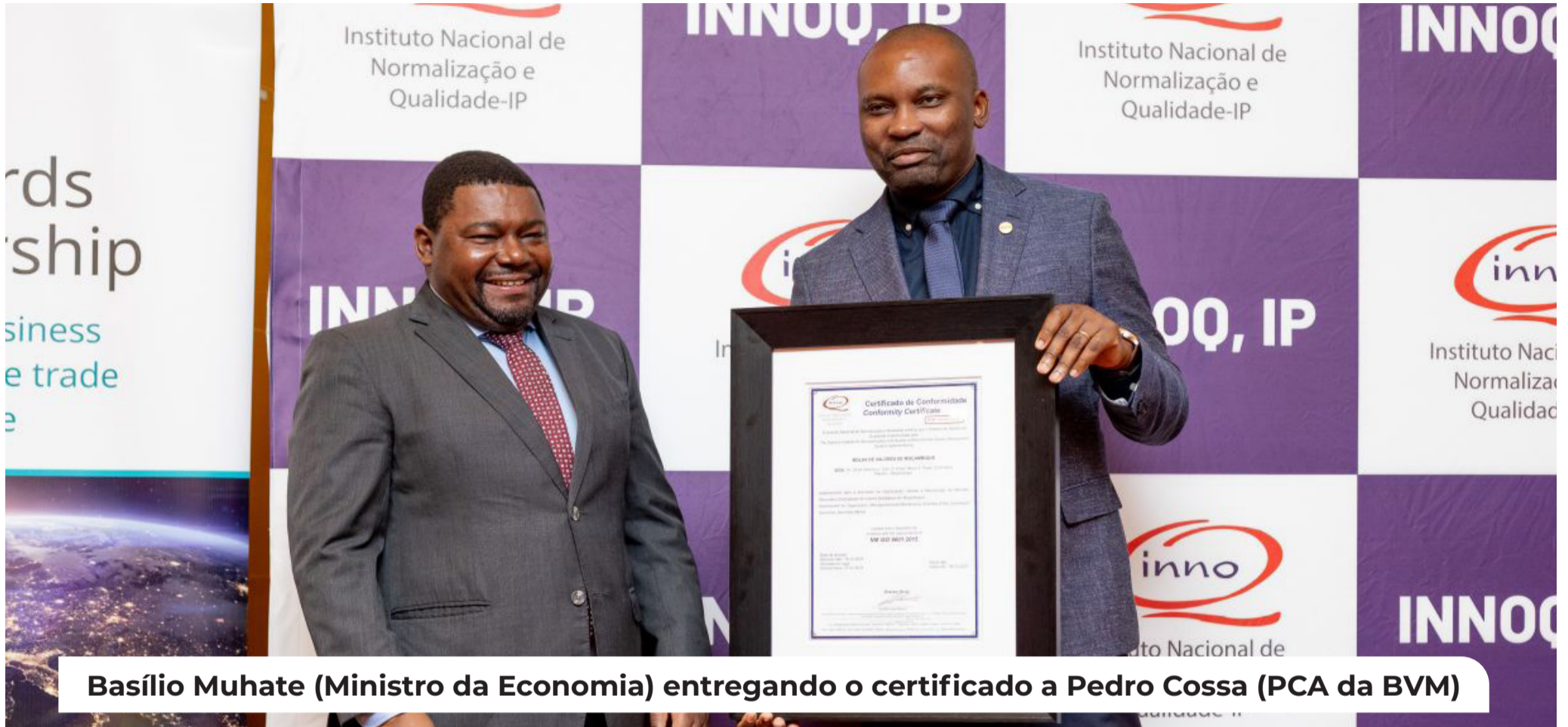
Basílio Muhate (Ministro da Economia) entregando o certificado a Pedro Cossa (PCA da BVM)

A Bolsa de Valores de Moçambique (BVM, S.A) é oficialmente, uma instituição certificada em sistema de Gestão de Qualidade ISO 9001:2015. A certificação, atribuída a 30 de Setembro, pelo Instituto Nacional de Normalização e Qualidade (INNOQ), demonstra o compromisso da empresa com a excelência operacional e a melhoria contínua dos serviços prestados ao mercado de capitais moçambicano.