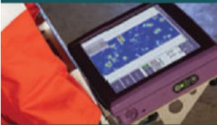
Alta Tecnologia em NDT