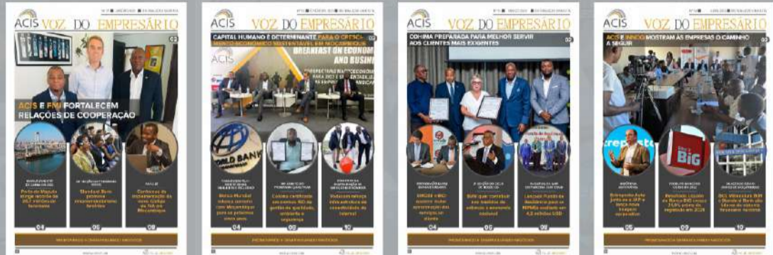
TABELA DE PUBLICIDADE NO BOLETIM INFORMATIVO VOZ DO EMPRESÁRIO