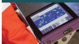
Alta Tecnologia em NDT