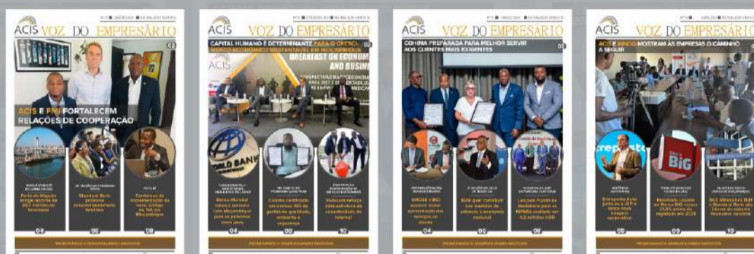
TABELA DE PUBLICIDADE NO BOLETIM INFORMATIVO VOZ DO EMPRESÁRIO