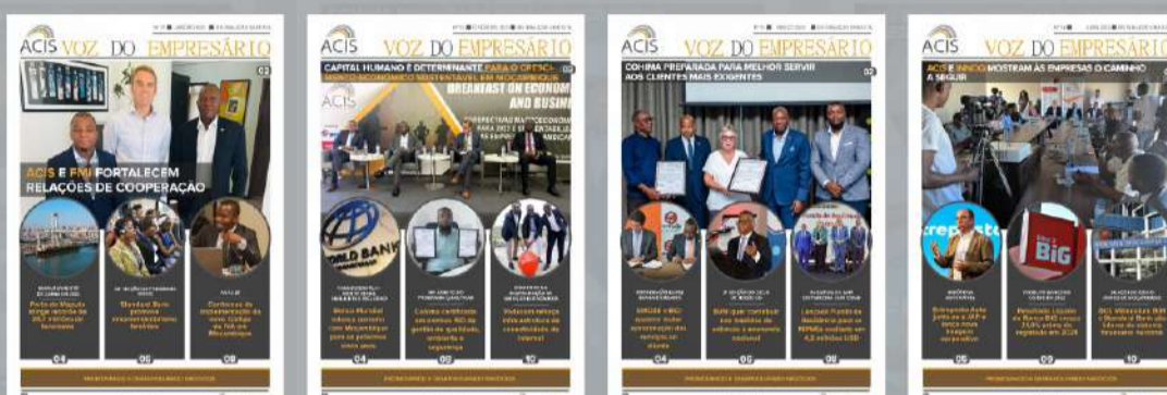
TABELA DE PUBLICIDADE NO BOLETIM INFORMATIVO VOZ DO EMPRESÁRIO