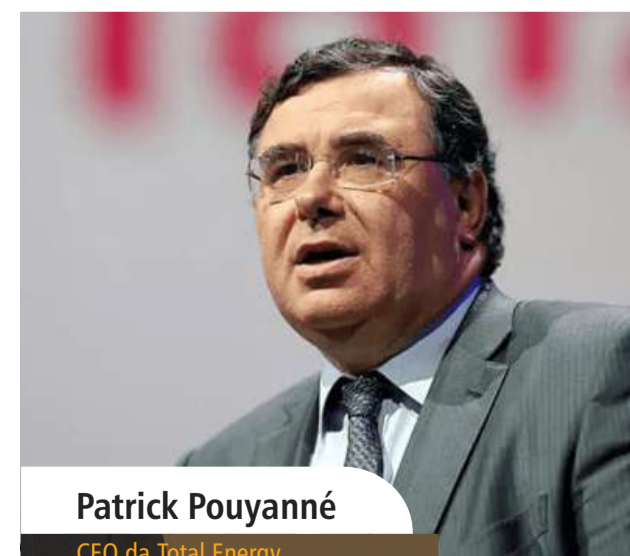
Patrick Pouyanné CEO da Total Energy

A suspensão do projecto representa um novo revés para o recém-empossado Presidente de Moçambique, Daniel Chapo, que se reuniu com Patrick Pouyanné a 28 de Janeiro, em Maputo.