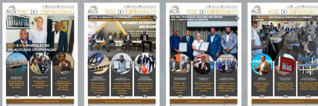
TABELA DE PUBLICIDADE NO BOLETIM INFORMATIVO VOZ DO EMPRESÁRIO