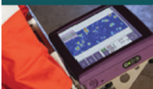
Alta Tecnologia em NDT