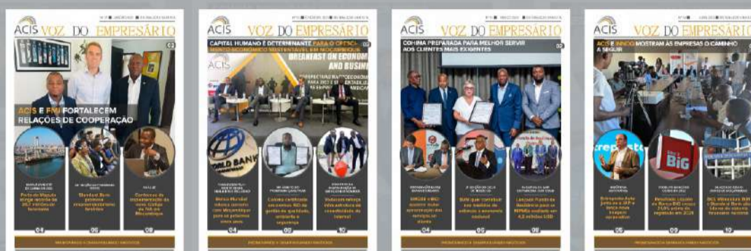
TABELA DE PUBLICIDADE NO BOLETIM INFORMATIVO VOZ DO EMPRESÁRIO