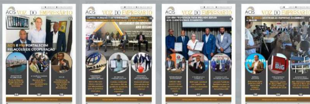
TABELA DE PUBLICIDADE NO BOLETIM INFORMATIVO VOZ DO EMPRESÁRIO