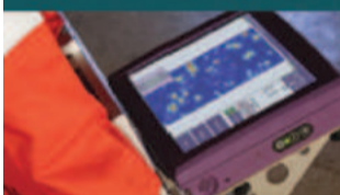
Alta Tecnologia em NDT