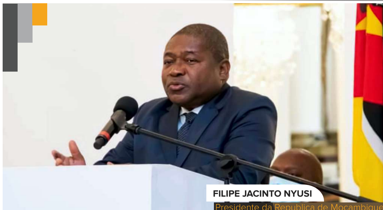
FILIPE JACINTO NYUSI

A Associação de Comércio, Indústria e Serviços (ACIS) e a italiana European House – Ambrosetti co-organizaram (a 4 de Agosto de 2022 em Maputo) o encontro dos CEO's e gestores de topo de grandes empresas africanas e europeias, com o Governo de Moçambique representado ao mais alto nível pelo Presidente da República, Filipe Nyusi. Participaram da reunião mais de 30 Homens de negócios entre moçambicanos e estrangeiros que operam nos ramos da Indústria Transformadora, Agronegócio, Energia, Logística, Turismo, Tecnologias de Informação e Comunicação, entre outros. O encontro da Comunidade dos CEO's com o Presidente Nyusi foi uma ocasião para um diálogo directo, com perguntas e respostas, onde os participantes tiveram a oportunidade de saber como explorar as potencialidades que Moçambique oferece para novos investimentos em diversas áreas. Neste contexto, os CEO's quiseram saber do Chefe de Estado Moçambicano o ponto de