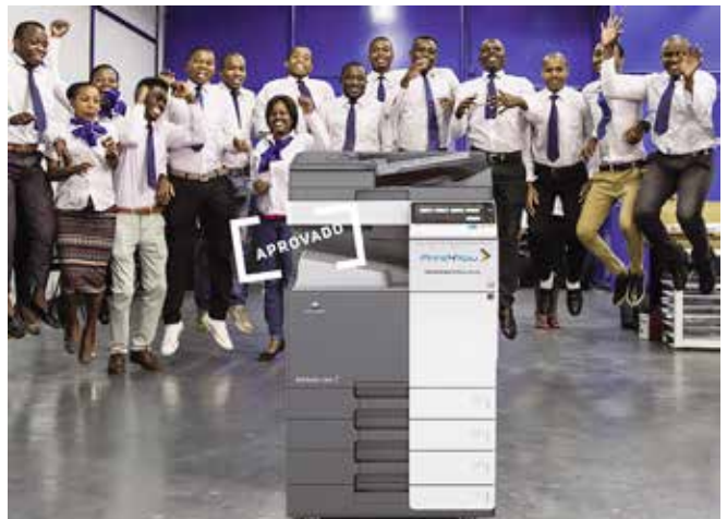
A equipa da Print4you

“Nas instalações da família Print4You, os dias de trabalho são distribuídos entre a oficina de manutenção das máquinas e equipamentos, armazém, escritórios e helpdesk . A sala de formação é frequentemente utilizada pelas acções de formação contínua. Para o período de descanso dos trabalhadores, foram criados importantes espaços para todos almoçarem e conviverem tranquilamente. Por fim, e porque numa casa as famílias têm expostas as suas fotografias, aqui também temos fotografias de todos os funcionários espalhadas por toda a parte, tudo isto para fazer com que os eles se sintam acarinhados e valorizados. Tenho a certeza que todos eles vestem e amam a camisola Print4You”, sentença.