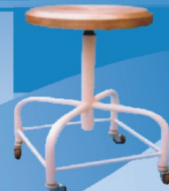
ST350/ST351 Suporte com balde em inox.