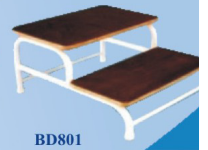
BD801 Degrau duplo.