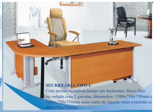
SECRETÁRIA TIPO L

Com pernas metálicas, tampo em melamine, bloco fixo ou rodado com 3 gavetas, dimensões: 1500x750x750mm e 1200x750x750mm mais canto de ligação mais extensão de 800x750x750mm.