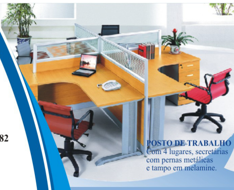
POSTO DE TRABALHO Com 4 lugares, secretárias com pernas metálicas e tampo em melamine.