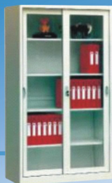
ARMÁRIO METÁLICO Portas de vidro.