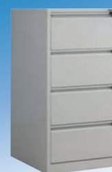
ARQUIVADOR METÁLICO Com 4 gavetas.