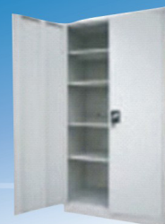
ARMÁRIO METÁLICO Com 2 portas, 4 prateleiras.