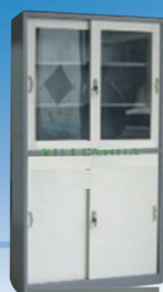
ARMÁRIO METÁLICO Misto.