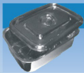
CAIXAS Para instrumentos com tampa.

Av. Acordos de Lusaka nº 1801 Tel.: +258 21 467553 • Fax: +258 21 465 282 Cell: +258 84 3929740 E-mail: mobiserv@teledata.mz Maputo - Moçambique