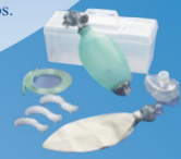
RESSUSCITADOR De parâmetros.