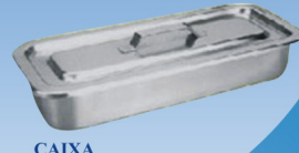
CAIXA Para instrumentos.