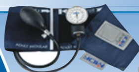
ESFIGMO MANOMETRO Portatel.