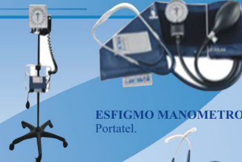
ESFIGMO MANOMETRO Portatel.