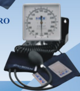
ESFIGMO MANOMETRO Aneroid de parede.