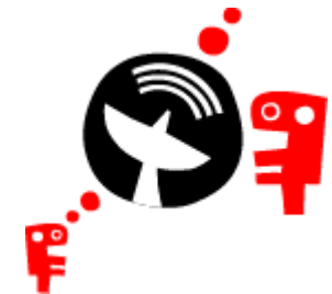
Telecoms & Media

Canalizamos os nossos esforços e recursos, trazendo a tecnologia para junto de si.