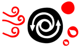
Energy & Utilities

Aliamos a nossa capacidade de integrar a tecnologia ao conhecimento específico do negócio dos nossos clientes.