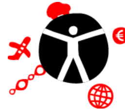
Government, Healthcare & Transportation